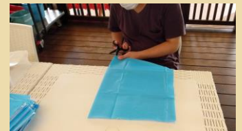
保育園での室内作業

小山・小山ヶ丘地区の皆さんがお世話になっている小山保育園さんでのワークです。保育園前の歩道や駐車場の雑草を抜いたり雨の日には室内で作業をします。日々のお忙しい保育のお手伝いができたらという思いで黙々と作業に励んでいます。